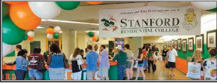
Şəkil 3. Stenford Universitetinin texnoparkının rezidentlər üçün təşkil olunmuş tədbirdən görüntü

Hazırda Amerikada 700-dən artıq texnopark, 150-dən çox İnformasiya Texnologiyaları - Parkı fəaliyyət göstərir 3 .