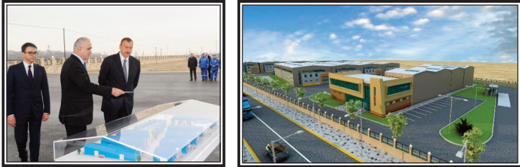
Şəkil 5. Balaxanı Sənaye Parkının təqdimatından

Bununla yanaşı, ölkədə sahibkarlığın dəstəklənməsi, müasir texnologiyalara əsaslanan sənaye müəssisələrinin təşkili və əhalinin istehsal sahəsində məşğulluğunun artırılması məqsədi ilə Azərbaycan Respublikası Prezidentinin 2011-ci il 28 dekabr tarixli, 1947 nömrəli Sərəncamı ilə Bakı şəhərində Balaxanı Sənaye Parkı yaradılmışdır.