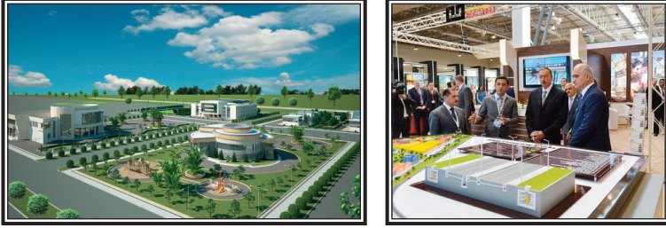
Şəkil 4. Sumqayıt Kimya Sənaye Parkının təqdimatından

Parkı 13 yaradılmışdır. Həmin Fərmanın 7.1-ci bəndinə əsasən Sumqayıt Kimya Sənaye Parkının fəaliyyəti üçün Azərbaycan Respublikası Dövlət Neft Şirkətinin "Azərikimya" İstehsalat Birliyinin ərazisindən 167,66 hektar torpaq sahəsinin Azərbaycan Respublikasının İqtisadiyyat və Sənaye Nazirliyinin istifadəsinə verilməsi müəyyən edilmişdir.