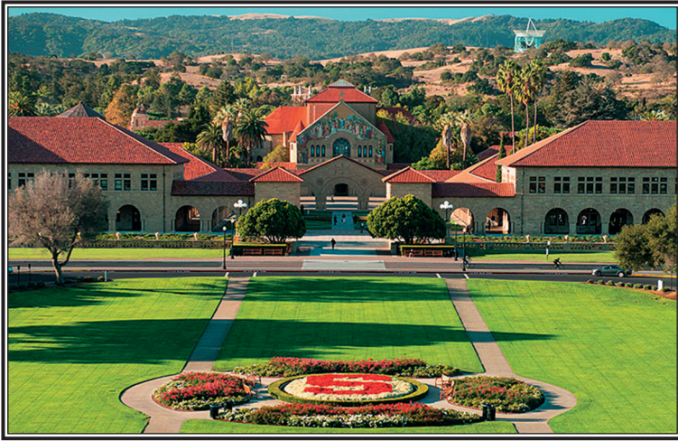
Şəkil 1. Stenford Universitetinin görüntüsü

Texnoparklar ilk dəfə XX əsrin 50-ci illərində ABŞ-da Stenford Universitetinin təşəbbüsü ilə yaradılmışdır. Həmin dövrdə universitetin yerləşdiyi Kaliforniya ştatında ABŞ hökumətinin sifarişi ilə hərbi sənaye məhsulları istehsal edən şirkətlər yüksək texnologiyalar sahəsində də müəyyən irəliləyişlər əldə etmişdilər. Ona görə də Stenford Universiteti bu şirkətlərə özünün boş qalmış ərazisində icarə yer vermək qərarına gəlir. Belə ki, boş qalmış həmin ərazilərin satılması Lilend Stenfordun vəsiyyəti ilə qadağan olunmuşdu. Bundan başqa, həmin şirkətlər bu və ya digər formada universitetlə əlaqəli şəkildə fəaliyyət göstərirdilər. Həmin ərazidə tikintinin başa çatması, infrastrukturun formalaşması və elmi parkın yaradılması üçün təxminən 30 il vaxt lazım gəlir. Silikon vadisi bu gün çox məşhur olan "Hewlett-Packard", "Polaroid", "Eastman Kodak", "General Electric", "Shojkley Transistor", "Lockheed" kimi şirkətlərin ilkin özünütədq meydanı olub.