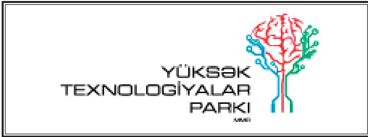
Şəkil 6. Yüksək Texnologiyalar Parkının logosu

Yüksək Texnologiyalar Parkı 14 Azərbaycanın yüksək texnoloji iqtisadi inkişafının təməl layihəsidir. Missiyası qabaqcıl avadanlıqlar, iqtisadi güzəştlər və biznes xidmətlərindən ibarət olan biznes üçün səmərəli mühiti təmin edərək Azərbaycanda və regionda yüksək texnologiyalara əsaslanan iqtisadiyyata töhfə verməkdir.